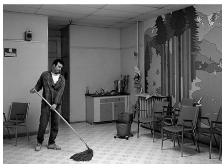
Jeff Wall (né en 1946)

Un support idéal pour imaginer, pour raconter.