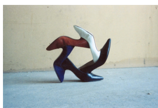
Peter Fischli et David Weiss.

Un support idéal pour faire parler les plus petits.